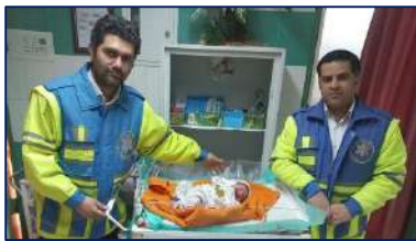
نوزاد دختری در داخل آمبولانس پا به عرصه حیات گذاشت ۱۴۰۱/۱۱/۱۵