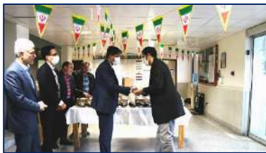
استقبال ریاست دانشگاه از آقایان به مناسبت ولادت حضرت امام علی (ع) ۱۴۰۱/۱۱/۱۶