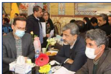
حضور ریاست دانشگاه در برنامه ارتباط مردمی با مردم در نماز جمعه این هفته شهرستان سرخه ۱۴۰۱/۱۱/۰۱