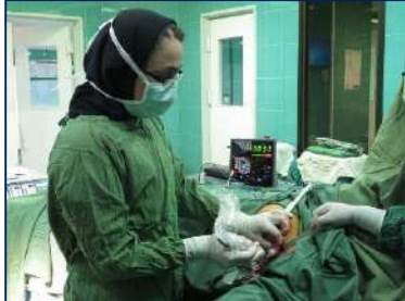
عمل جراحی موفق برداشتن غده لنفاوی با استفاده از دستگاه گاماپروب در بیمارستان کوثر ۱۴۰۱/۱۱/۱۱