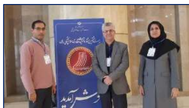
حضور معاون و مدیران تحقیقات و فناوری دانشگاه در بیست و هشتمین جشنواره تحقیقات و فناوری علوم پزشکی رازی ۱۴۰۱/۱۱/۰۵