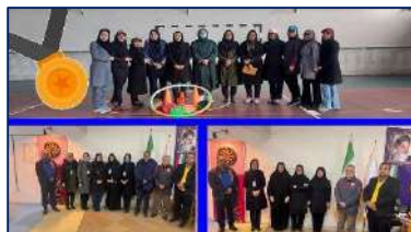
بانوان ورزشکار دانشگاه، قهرمانان و نائب قهرمانان مسابقات کارکنان دستگاههای اجرایی استان سمنان ۱۴۰۱/۱۱/۰۲