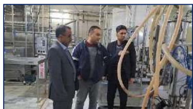
بازدید معاون غذا و دارو دانشگاه از کارگاه لبنی سمنان ۱۴۰۱/۱۱/۰۲