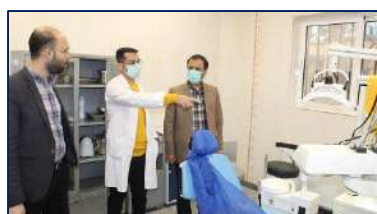
بازدید مدیر شبکه بهداشت و درمان شهرستان دامغان از مرکز خدمات جامع