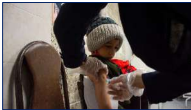
برنامه عملیات واکسیناسیون تکمیلی در جمعیت پناهندگان و مهاجرین خارجی در دانشگاه به ایستگاه آخر رسید ۱۴۰۱/۱۱/۱۵