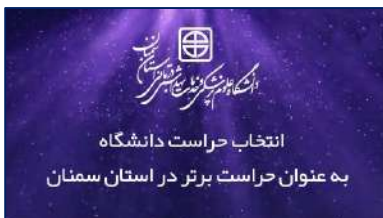
انتخاب حراست دانشگاه به عنوان حراست برتر در استان سمنان ۱۴۰۱/۱۱/۲۰