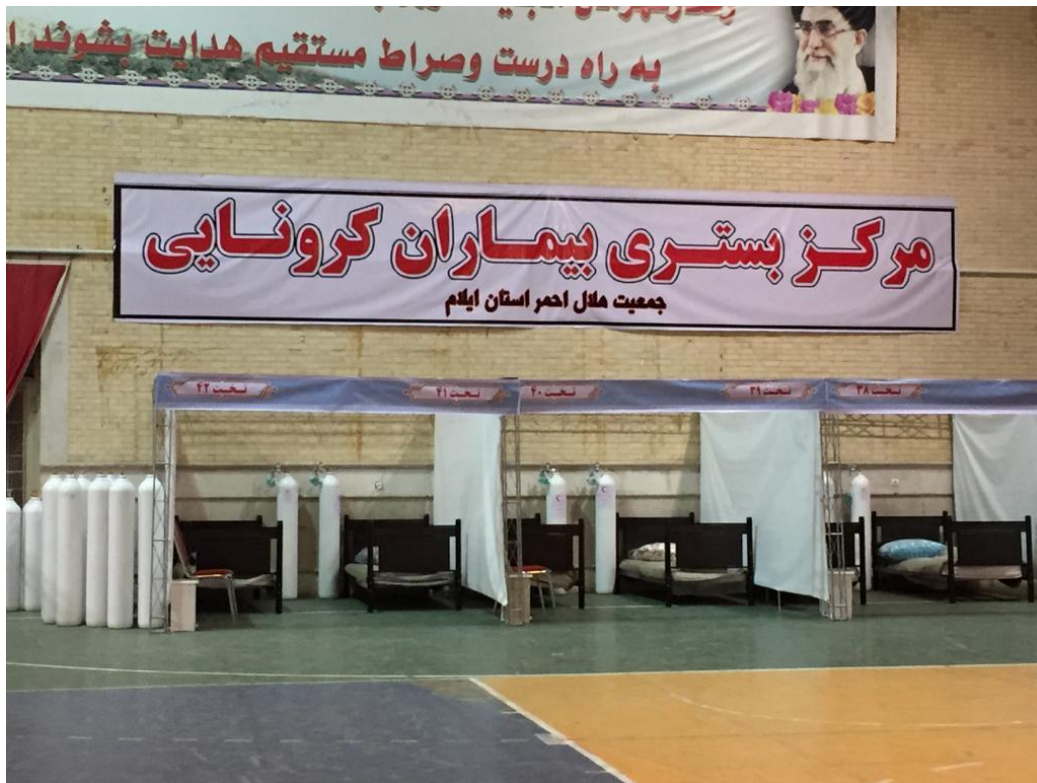
شکل شماره ۴- جداسازی فضاهای بستری در واحد بستری اولیه