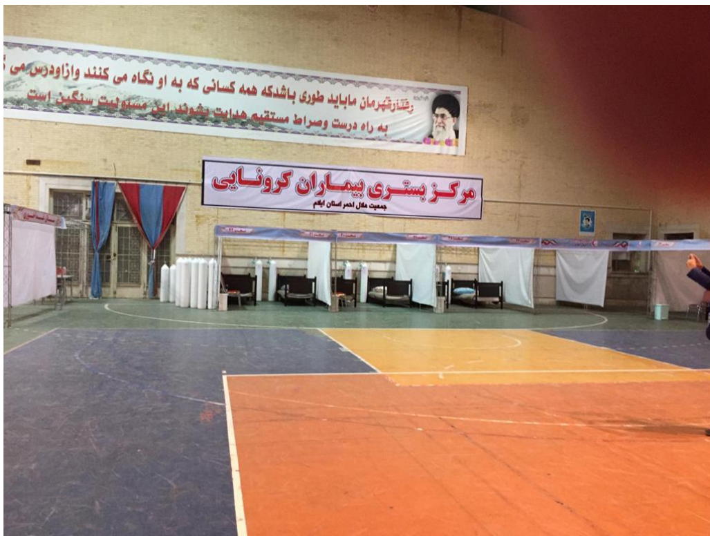
شکل شماره ۷- فضای کلی نمونه ای از واحد بستری اولیه