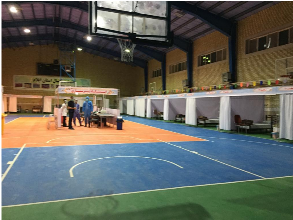
شکل شماره ۲- فضای کلی نمونه ای از واحد بستری اولیه