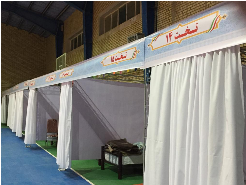
شکل شماره ۶- فضاهای بستری تفکیک شده در واحد بستری اولیه