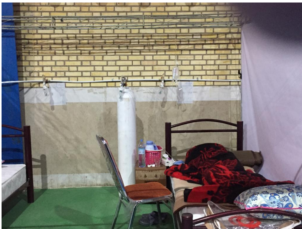
شکل شماره ۳- فضای بستری بیمار