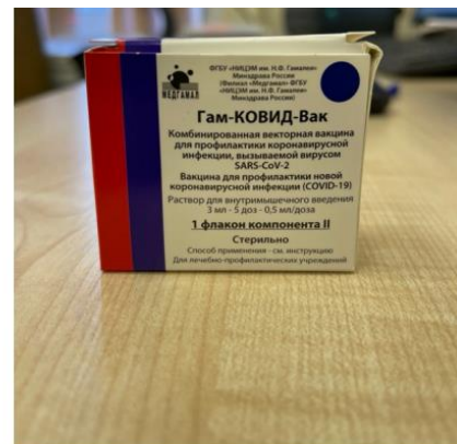
Component II (secondary packaging)

Paper box containing 5-dose vial for 3 ml