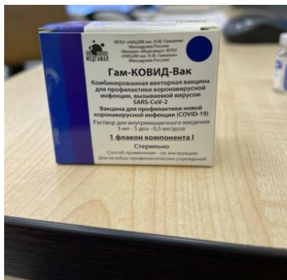
Component I (secondary packaging)

Paper box containing 5-dose vial for 3 ml